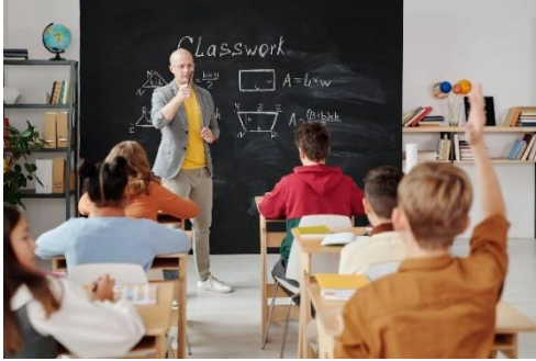
Image 2. Teacher Asking a Question to the Class