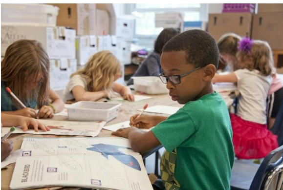
Image 4. Boy In Green Shirt