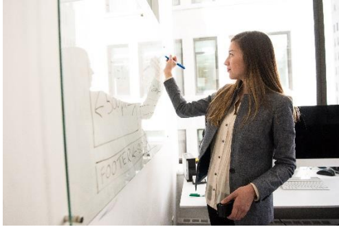
Image 3. Woman Wearing Gray Blazer Writing on Dry-erase Board

חכם - חייכן - ממושמע היטב - חוש הומור - נלהב - חברתי - מסודר - אמיץ - ייחודי - מעריך את עצמו - לא אנוכי.