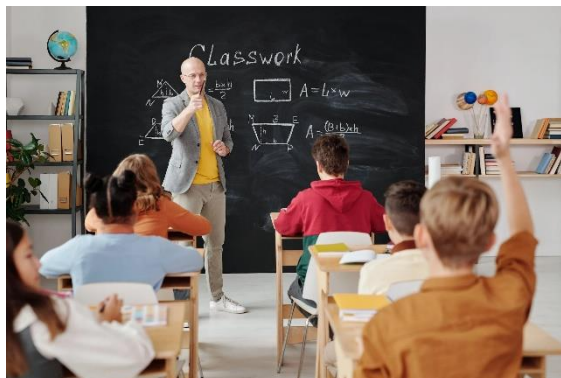
Zīm 2. Skolotājs uzdod jautājumu klasei