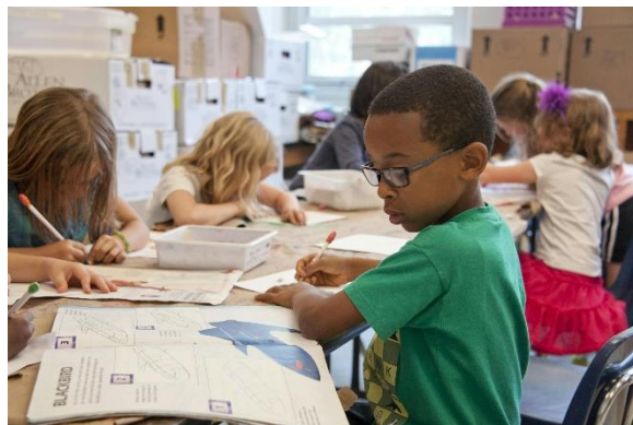
Zīm 4. Zēns zaļā T-kreklā