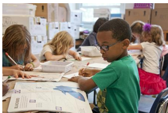
Pav. 2. Mokiniai